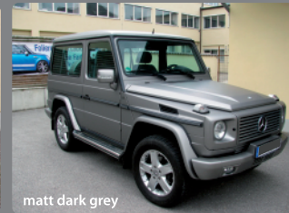
matt dark grey