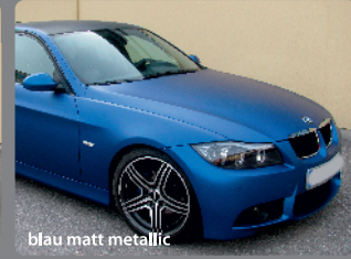
blau matt metallic