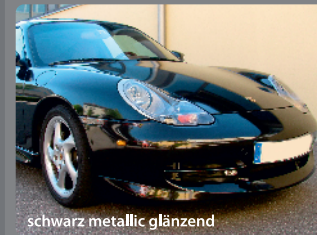
schwarz metallic glänzend