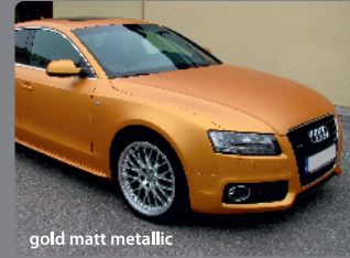
gold matt metallic

Mehr Infos und Videomaterial unter: www.IndividualCar.de